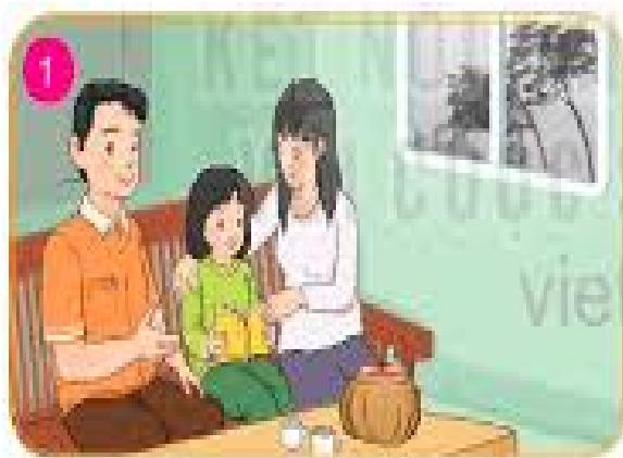
Ở trong nhà khi trời mưa dông, lốc, sét.

Ngắt các thiết bị điện: Tắt các thiết bị điện không cần thiết như tivi, máy tính, quạt điện để phòng tránh chập cháy do sét đánh lan truyền. Rút phích cắm các thiết bị điện tử, hạn chế sử dụng điện thoại di động